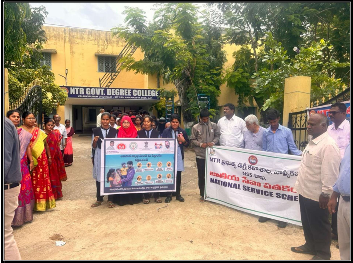
RALLY ON DIARIA ON 14.07.2024