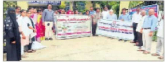
అవగాహన కల్పిస్తున్న వైద్య సిబ్బంది