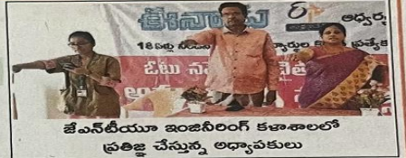
విభాగాధిపతి అవధర్, సిబ్బంది పాల్గొన్నారు.

గాహనపై సదస్సు నిర్వహించారు. ఈ సందర్భంగా ఆయన మాట్లాడుతూ... 18 ఏళ్లు నిండిన ప్రతిఒక్కరూ ఓటు హక్కు తప్పనిసరిగా పొందాలన్నారు. బావితరాల భవిష్యత్తు కోసం ఓటు హక్కును వినియోగించుకుని పోలింగ్ శాతాన్ని పెంచే బాధ్యత యువతపై ఉందన్నారు. కార్యక్రమంలో ఈసీఈ