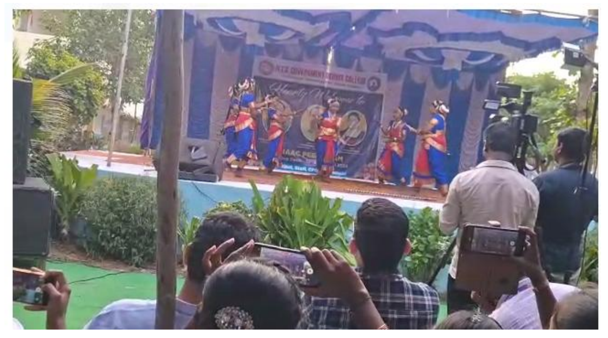
Students performing in the cultural programme