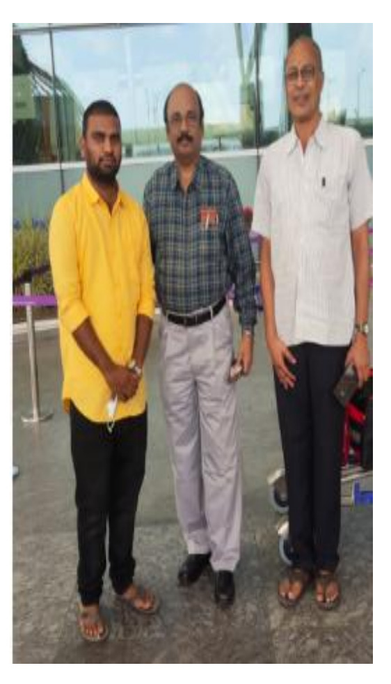
While dropping the chairperson at the Airport, Bangalore