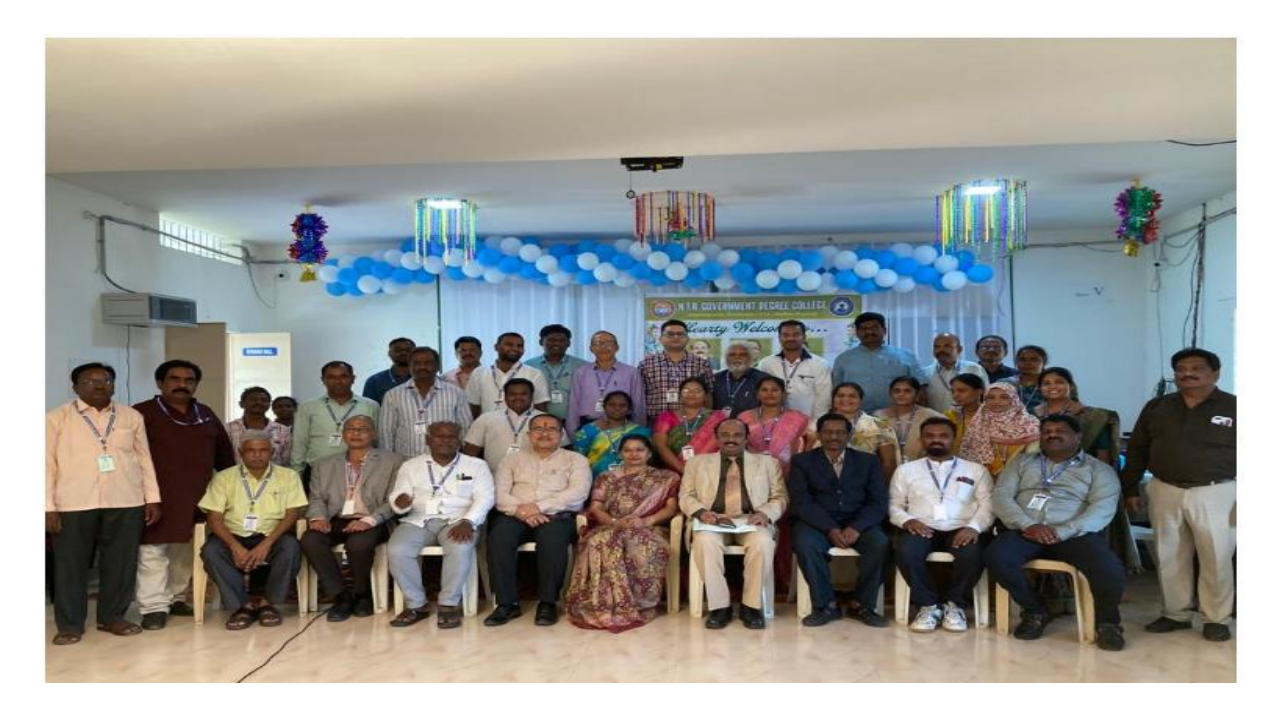
Group Photo with Peer Team Members