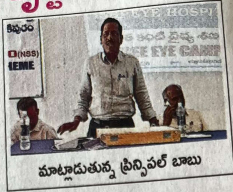
మాట్లాడుతున్న ప్రిన్సిపల్ బాబు

వాల్మీకిపురం, న్యూస్టుడే : యువ తలో ప్రస్తుతం దృష్టి సమస్యలు తరచూ తలెత్తుతున్నాయని, వీటిపై దృష్టి సారిం చాల్సిన అవసరం ఎంతైనా ఉందని డిగ్రీ కళాశాల ప్రిన్సిపల్